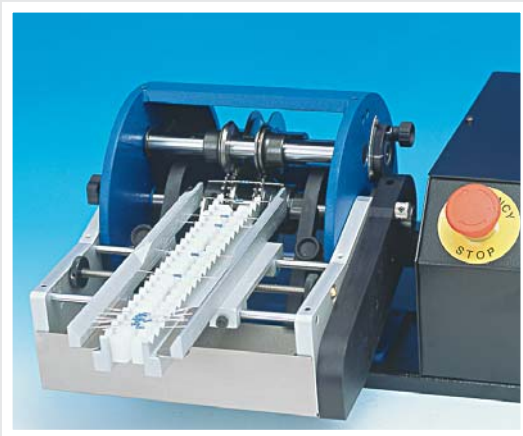
CARICATORE CS10 per :TP6, TP6/PR-B, TP6/S CS10 FEEDER for: TP6, TP6/PR-B, TP6/S (Cod. 51.0100)