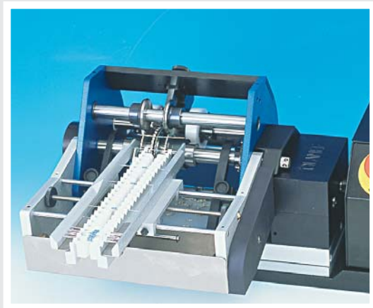
CARICATORE CS20 per TP6/V-PR CS20 FEEDER for TP6/V-PR (Cod.51.0200)