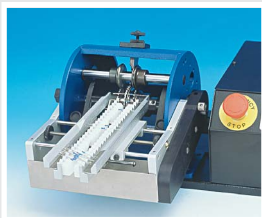
CARICATORE CS30 per TP6/V CS30 FEEDER for TP6/V (Cod.51.0300)