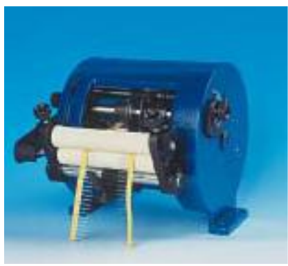
21.0011 TNS waste tape ejector espulsore nastro di scarto

The TP6/S machine is designed for cutting and bending axial components for surface mount. The standard version offers the most common dimensions. Special versions to customer's specifications are available upon request.