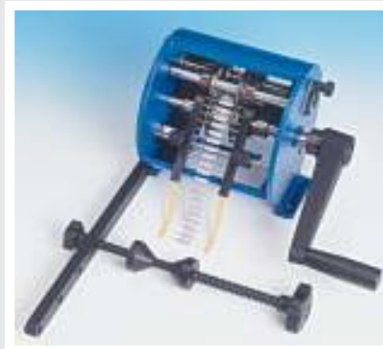
400200 BR6 reel holder braccio porta bobina