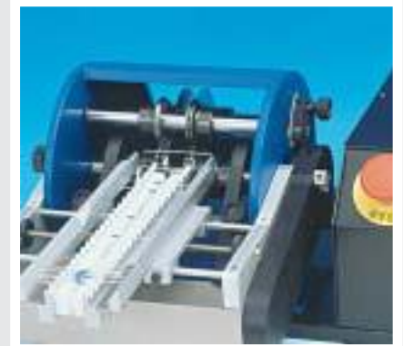
51.0100 CS10 feeder for loose components caricatore per componenti sfusi