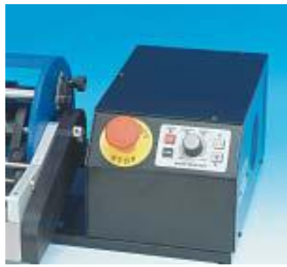
7915030/31 MOT98 motor - motore